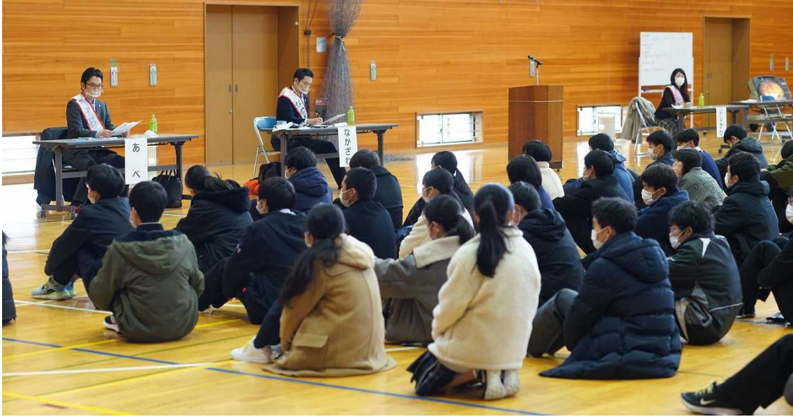
弁護士 3 名の方が市長に立候補