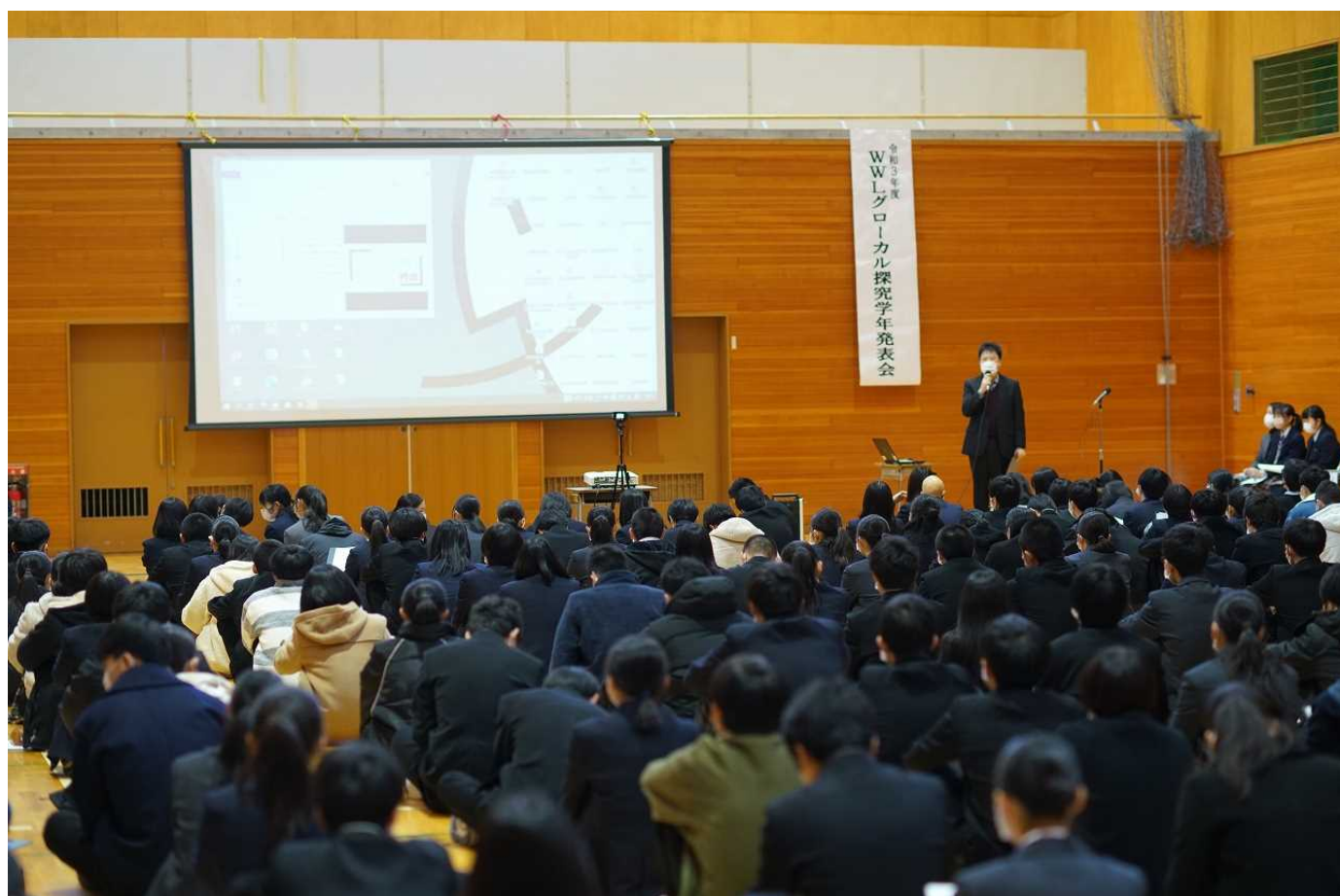
1 学年グローバル探究発表会の様子