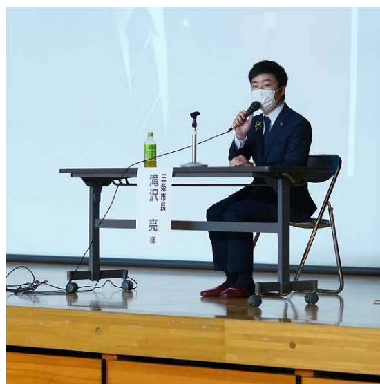
三条、燕、加茂の3市長は 全員三高 OBOG