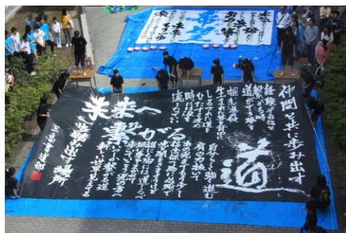
文化祭における書道部パフォーマンス