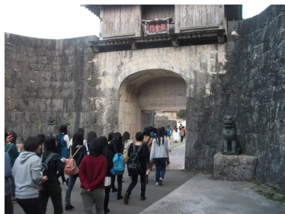
修学旅行(沖縄・首里城)