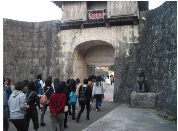
修学旅行(沖縄・首里城)